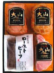
Y-222 カタログ価格 8,640円 特別価格 6,480円 オニオンケーゼ 250g/ボンレスハム 360g/ローストビーフ 200g/ カントリーロースト 300g