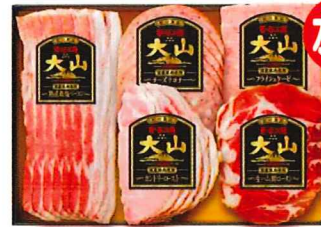
Y-350 カタログ価格 3,240円 特別価格 2,430円

熟成乾塩ベーコン 80g チーズリヨナー90g フライシュケーゼ 80g カントリーロースト 72g 生ハム(肩ロース) 40g