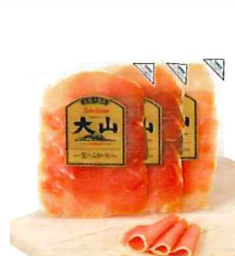
006 生ハムロース (スライス) 40g×3 カタログ価格 1,480円