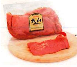
020 パストラミビーフ (スライス) 200g/1個 カタログ価格 1,320円