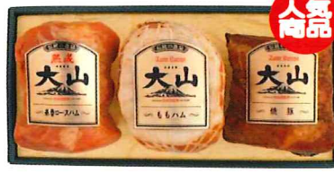
S-135 カタログ価格 6,000円 特別価格 4,500円 熟成糸巻ロースハム 360g/ももハム340g / 焼豚 340g