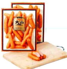
009 あらびきポークウィンナー 280g×2 カタログ価格 1,980円