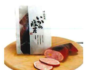
022 いかの腹芸 (ブロック) 1袋 カタログ価格 1,600円