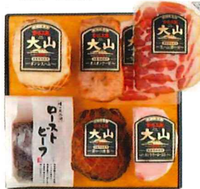
Y-228 カタログ価格 10,800円 特別価格 8,100円 ボンレスハム360g/オニオンケーゼ 250g/ 生ハム(肩ロース) 40g×2/ローストビーフ 200g/肩ロース焼豚 250g/ カントリーロースト 300g