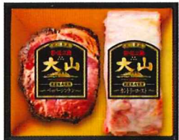
Y-213 カタログ価格 6,000円 特別価格 4,500円 ペッパーシンケン 400g/ カントリーロースト 400g

熟成乾塩ベーコン 80g ボンレスハム 125g チーズリヨナー 90g あらびきポークウィンナー 150g ふんわりポークウィンナー 120g ペッパーシンケン 72g カントリーロースト 72g 生ハム(肩ロース) 40g