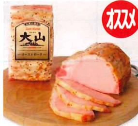
015 ローストポーク (ブロック) 400g/1個 カタログ価格 2,750円