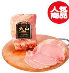
001 カントリーロースト (スライス) 280g/1個 カタログ価格 2,420円

※このシリーズは、包装・熨斗(のし) 掛けなど贈答用としてのご注文は承っておりません。ご了承ください。