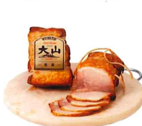
003 焼豚 (ブロック) 340g/1個 カタログ価格 2,000円