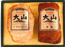
S-131 カタログ価格 3,600円 特別価格 2,700円 ももハム 340g/焼豚 340g

※ご注文を頂いてからお届けまでに10日前後掛かる場合がございます。お早目のご注文をお願い致します。