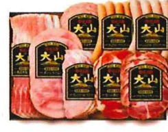
Y-527 カタログ価格 5,400円 特別価格 4,050円

熟成乾塩ベーコン 80g ボンレスハム 125g チーズリヨナー 90g あらびきポークウィンナー 150g ふんわりポークウィンナー 120g ペッパーシンケン 72g カントリーロースト 72g 生ハム(肩ロース) 40g