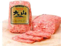
018 ピッツアアローフ (ブロック) 250g/1個 カタログ価格 1,500円