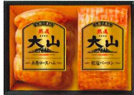
S-305 カタログ価格 3,240円 特別価格 2,430円 熟成糸巻ロースハム360g/ 熟成乾塩ベーコン200g