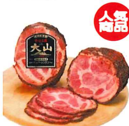
002 ペッパーシンケン (スライス) 280g/1個 カタログ価格 2,420円