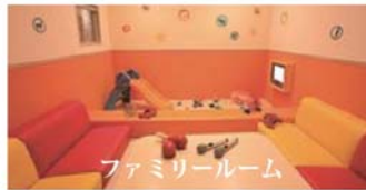
ファミリールーム