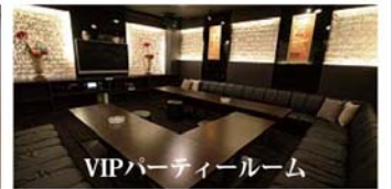
VIPパーティールーム